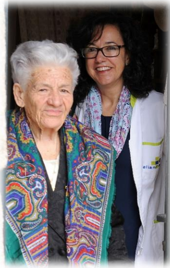
El poema de Isabel

La figura del cuidador profesional también es importante y por ello hemos querido reconocer su entrega, cariño y la capacidad demostrada en su labor como cuidadores.