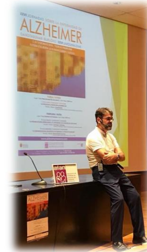
Cuidados basados en mindfulness: el corazón del cuidado