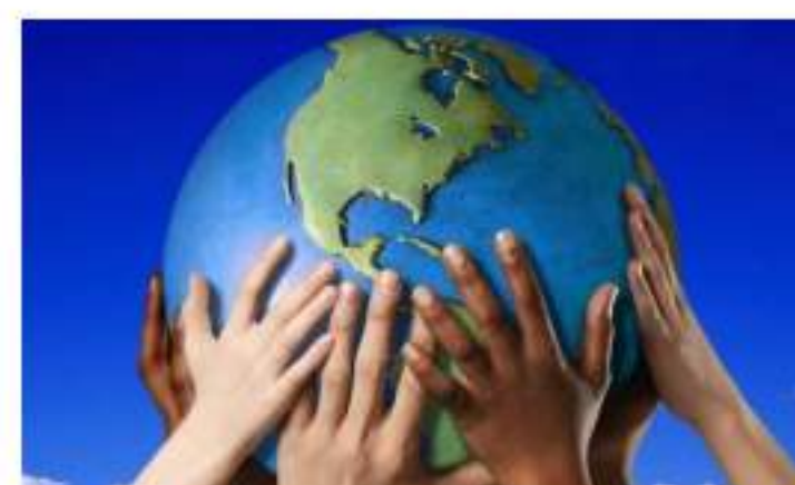
Inidress lleva la RSS a las pymes españolas