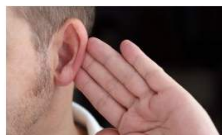
Atenuar los efectos del párkinson por el oído