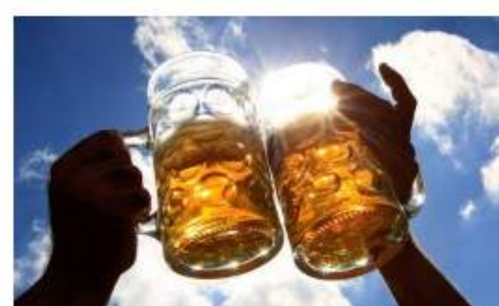
Ser celiaco e irse de cañas ya no es incompatible